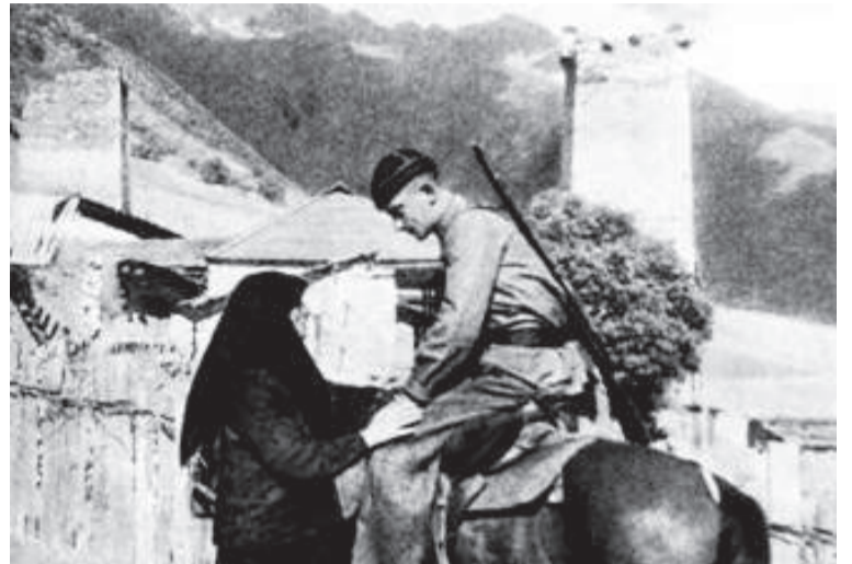
(сураталда: вас нуха регIуллей эбел)

Чохъол эбел, лъала дур рекIел ургъел, Васал цере рачIун, дуй гъечIеб хIалхьи. РагIула дида дур каранзул гIвапи, ГIанчIазухъ ракI унтун угулеб хIухъел.