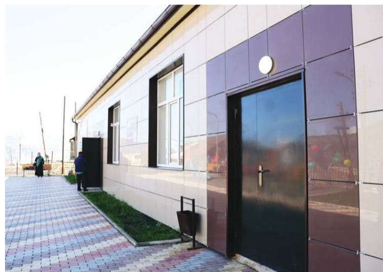
ГIуцIизе жигар бахъизе бугиланги абуна министралъ.

Гъаб берцинаб, санагIалъабиги гIураб культура-якъул рукъ букIине ккела росулъ тIоритIулел тадбиразе интерес багъаризабулеб, эркенаб заманалда росдал гIадамаз хIухъ бахъулеб бакIлун, рухIияб тарбия къезе хIалтIизабулеблун. Гъеб кинабгоялье байбихъилгун ккола нильер жакъасеб дандельиги, -ян абуна Дагъистаналъул культура-якъул министр Зарема Бутаевалъ. Росдал лъималазе спектакль бихъизабизе Дагъистаналъул пачалихъияб ясикабазул театр битIизе бугин Гъигъальеян тIадеги жубана гъелье.