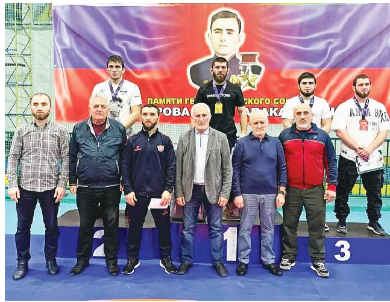
(97 кг. чемпион ва призерал)