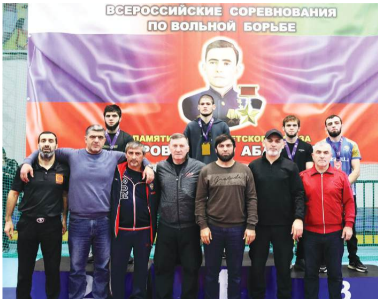
(65 кг. чемпион ва призерал)

Спорт бокъулезе ключонарел лахIзаталги тун, къеца ана гIадегIанаб даражаялда. Гъеб иналъе аслияб куцалъ квербакъи гъабун ритIухъал судиябазул къокъаялъ. Бергъаразе ва призеразе къуна Пачалихъияб Думалялъул депутатазул, батIи-батIиял идарабазул нухмалъулезул ва цогидазулги рахъалъан ГIарцулал шапакъаталгун раклалде швейлъе сайгъатал, баркалаялъул кагъталгун хIурматалъул гра-