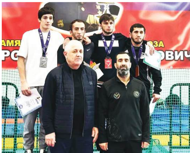
(61 кг. чемпион ва призерал)

Турниралъул чемпионасе ва призерасе къуна рекъон кколел даражабазул грамотабигун медалал ва 15000, 10000 ва 5000