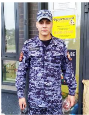
Г'емер руго нильер районялъул призвалда рекъон