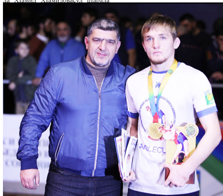
бугеб спортивиял КӀалгӀаялда тобитӀана Россиялгъу спорталгъу

эркенаб гугариялгъу рахӀаль халкъазда гьоркъосел иргадубал турнир.